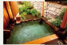
翠泉の湯露天風呂