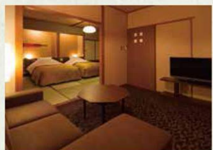
ゆったり和室ツイン 広縁なスタイルもございます。