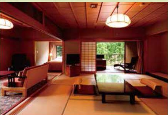
露天風呂付くつろぎスイート