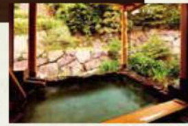
翠泉の湯露天風呂